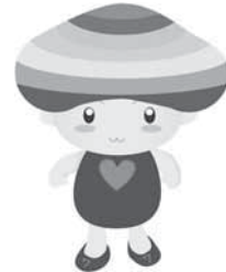
豊後大野市マスコット キャラクター『ヘプタゴン』

大分県豊後大野市では、学校教育基本方針として「地域とともにあるヘプタゴン教育（ヘプタゴン教育：豊後大野っ子の夢を叶える教育）」を掲げている。また基本目標としては、「『主体的な自己実現』をめざして」を設定し、ヘプタゴン教育の7つの柱（①キャリア教育の推進、②連結型小中一貫教育、校種間連携の推進、③コミュニティ・スクールの充実、④確かな学力の育成、⑤豊かな心の醸成と健康な体の育成、⑥郷土学の推進、⑦学校環境の充実）を中心とした重点方針を挙げている。本市では特に最近12年間で、児童生徒数が20%減少している。少子化の引き起こす影響は、全県・全国的な課題である。この課題に対して、学校の統合ではなく、連結型小中一貫教育を進め、小中一貫教育校の設置を推進することを通して、家庭・地域との協働にも力を入れ、豊後大野市の特性を生かした「地域とともにある学校づくり」を目指している。