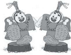
千歳町小中連携マスコット キャラクター『ひょうたん様』

千歳小学校、千歳中学校では、これまでの小中連携の取組を進めていく中で、ふるさとである千歳の地を愛する子どもたちの育成や、地域・保護者との協働を学校経営の重点に据え、「地域ととも